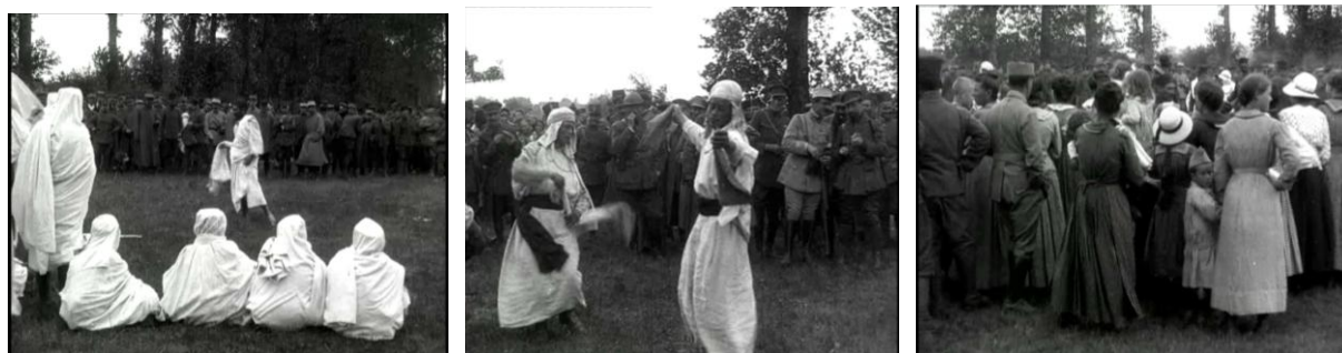
Photogrammes extraits du film Fête tunisienne, le 6 juillet 1917 . Noir et blanc, muet, durée : 00:03:48. Réf. 14.18 B 462.

Non loin du camp de Mailly, les troupes tunisiennes installent leur quartier dans le village de Chaudrey. Les troupes exécutent plusieurs danses lors d'une fête organisée à l'occasion d'une visite de journalistes.