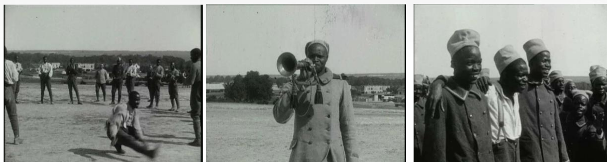
Photogrammes extraits du film Les Sénégalais au repos à Mailly-le-Camp Noir et blanc, muet, durée : 00:07:27. © ECPAD. Réf. 14.18 A 189.

De nombreux films sont ainsi réalisés dans le camp militaire de Mailly. Plusieurs nationalités de combattants transitent par ce camp. L'arrivée des troupes russes en Champagne est également filmée à Mailly (réf. 14.18 A 1228). Italiens et Américains sont eux aussi de passage dans l'enceinte du camp (réf. 14.18 B 207 et 14.18 A 1156). Autre contingent passé par le camp, les tirailleurs sénégalais faisant partie des troupes coloniales. Ces combattants venus d'Afrique sont filmés au repos, ou lors de séances de jeux et de danses. Le camp de Mailly voit également apparaître de nouvelles armes destinées à mettre rapidement fin à la guerre. Plusieurs tournages sont ainsi consacrés aux déploiements de chars lors de manœuvres organisées avec des unités d'infanterie, montrant l'essor de l'armée blindée sur le champ de bataille (réf. 14.18 A 559, 14.18 A 560 et 14.18 A 561).