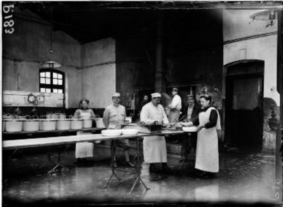
Référence : SPA 15 P 183 Cuisines réservées à la classe 1917 du 36 e régiment d'infanterie à Caen. 12 avril 1916.