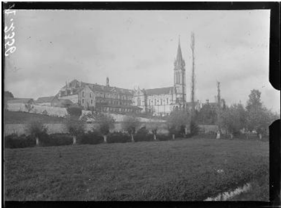
Référence : SPA 69 A 2356 L'hôpital sanitaire n°45 à Hérouville, près de Caen. Novembre 1917.