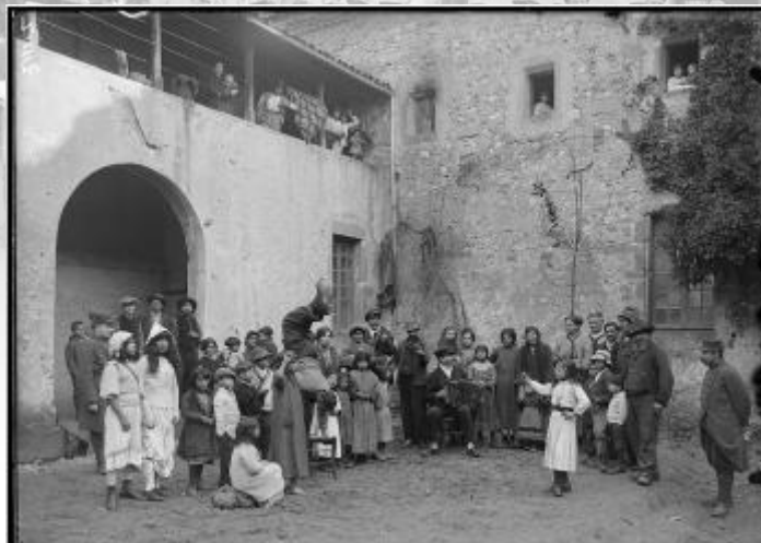
Référence : SPA 24 Z 1117 Concert de nomades dans une cour du camp de Crest. Janvier 1916.