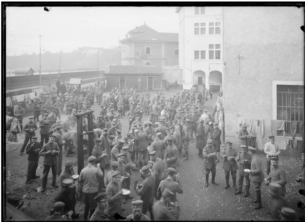
Référence : SPA 24 Z 1175 Romans. Distribution de soupe dans la cour du dépôt de prisonniers. 24 décembre 1915.