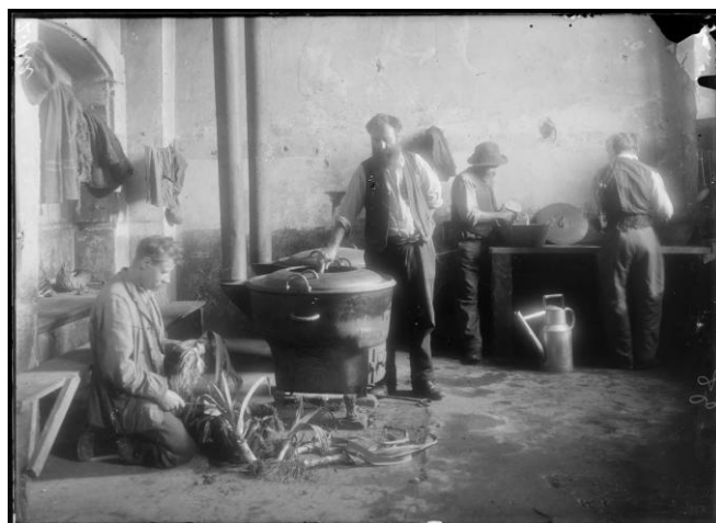
Référence : SPA 24 Z 1122 Camp de Crest. Alsaciens-Lorrains aux cuisines. Janvier 1916.