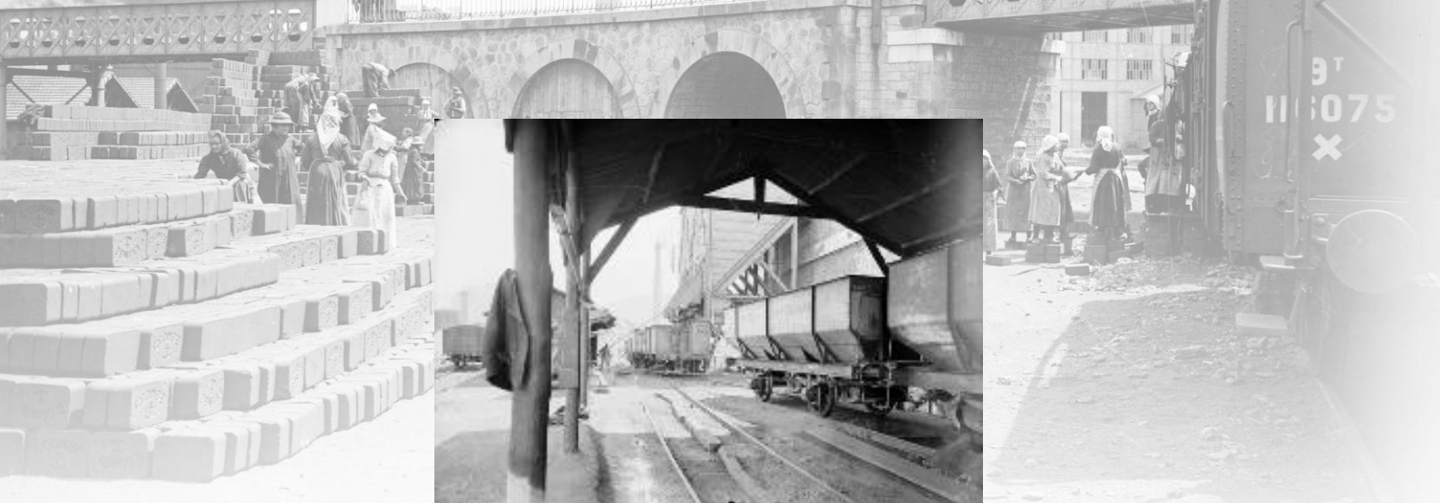
Référence : SPA 40 P 422 La Grand-Combe, chargement du charbon dans les wagons du site minier. 9 juillet 1916.