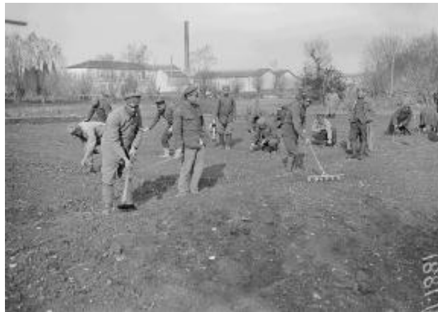
Référence : SPA 60 V 1881 Nîmes. Des prisonniers bulgares participent aux travaux agricoles. 7 avril 1917.