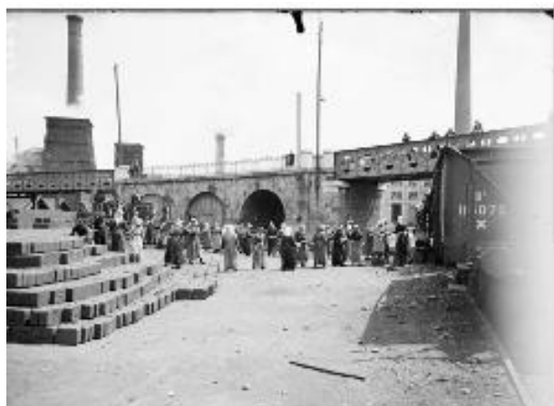
Référence : SPA 40 P 425 À La Grand-Combe, les femmes travaillent à la mine, notamment au chargement des briquettes. 9 juillet 1916.