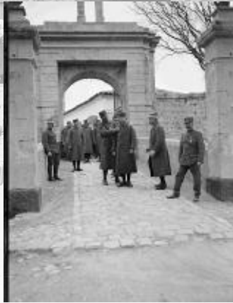
Référence : SPA 61 V 1971 À Alais (Alès), au fort Vauban, des tirailleurs marocains sortent en quartier libre. 23 avril 1917.