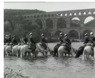
Photogrammes extraits du film Spahis algériens en marche . Date inconnue. Noir et blanc, muet, durée : 04 mn 59 secondes. Référence : 14.18 B 291.

Images également utilisées dans un montage comprenant des images de 1918 en hommage à l'armée coloniale et référencées : 14.18 B 315.