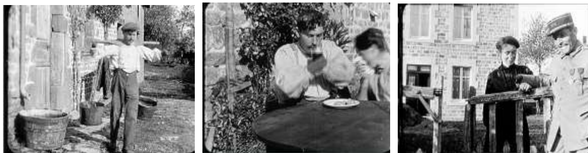
Photogrammes extraits du film :

Ce que peut faire un mutilé des deux mains.