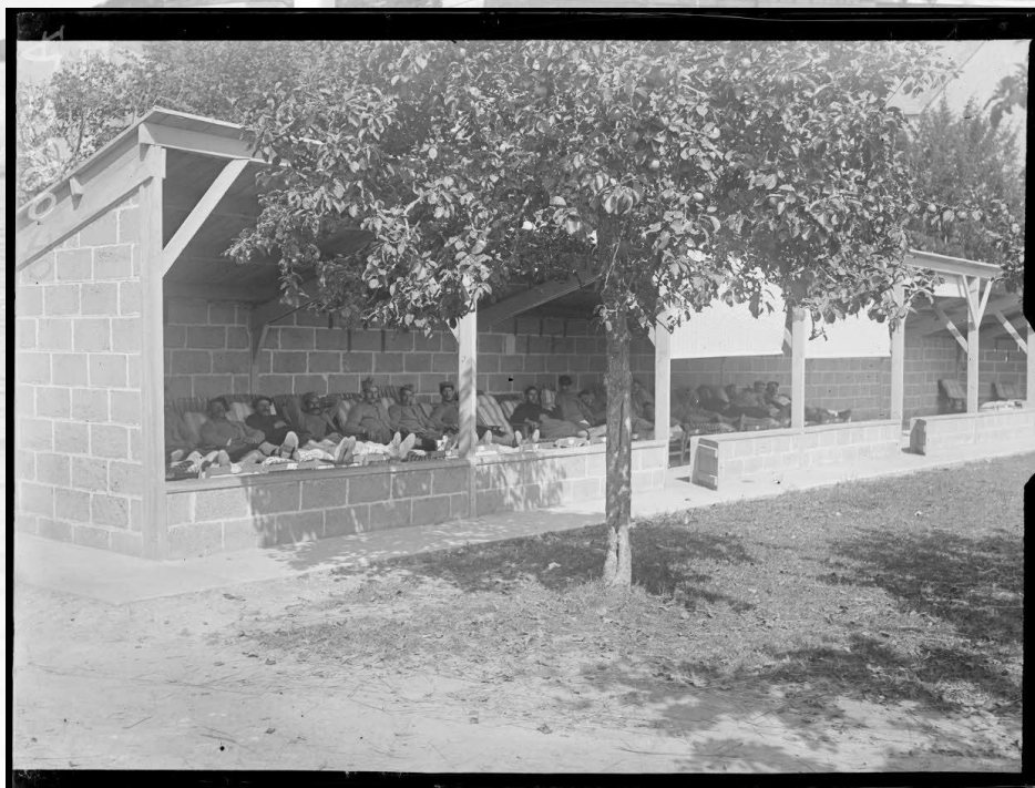
Référence : SPA 64 A 2180 Sainte-Anne-d'Auray. Hôpital sanitaire n°64, cure d'air. Septembre 1917.