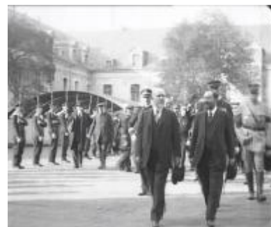
Photogrammes extraits du film

Nos marins dans les airs. Les héros du Kléber (1917)