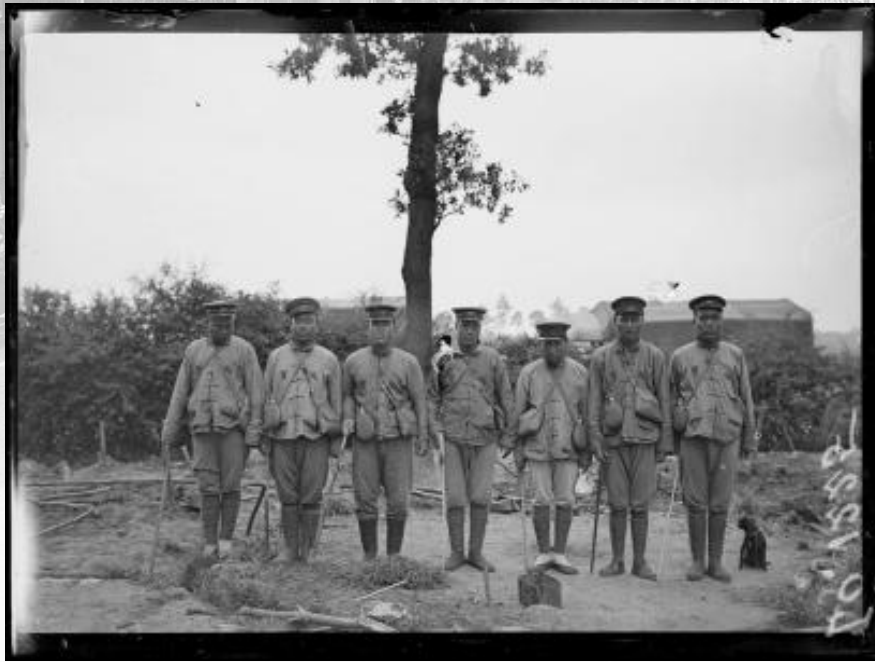
Référence : SPA 15 LO 1225 À Oudezeele, au camp des travailleurs chinois, des groupes partent pour les travaux. Juin 1918.