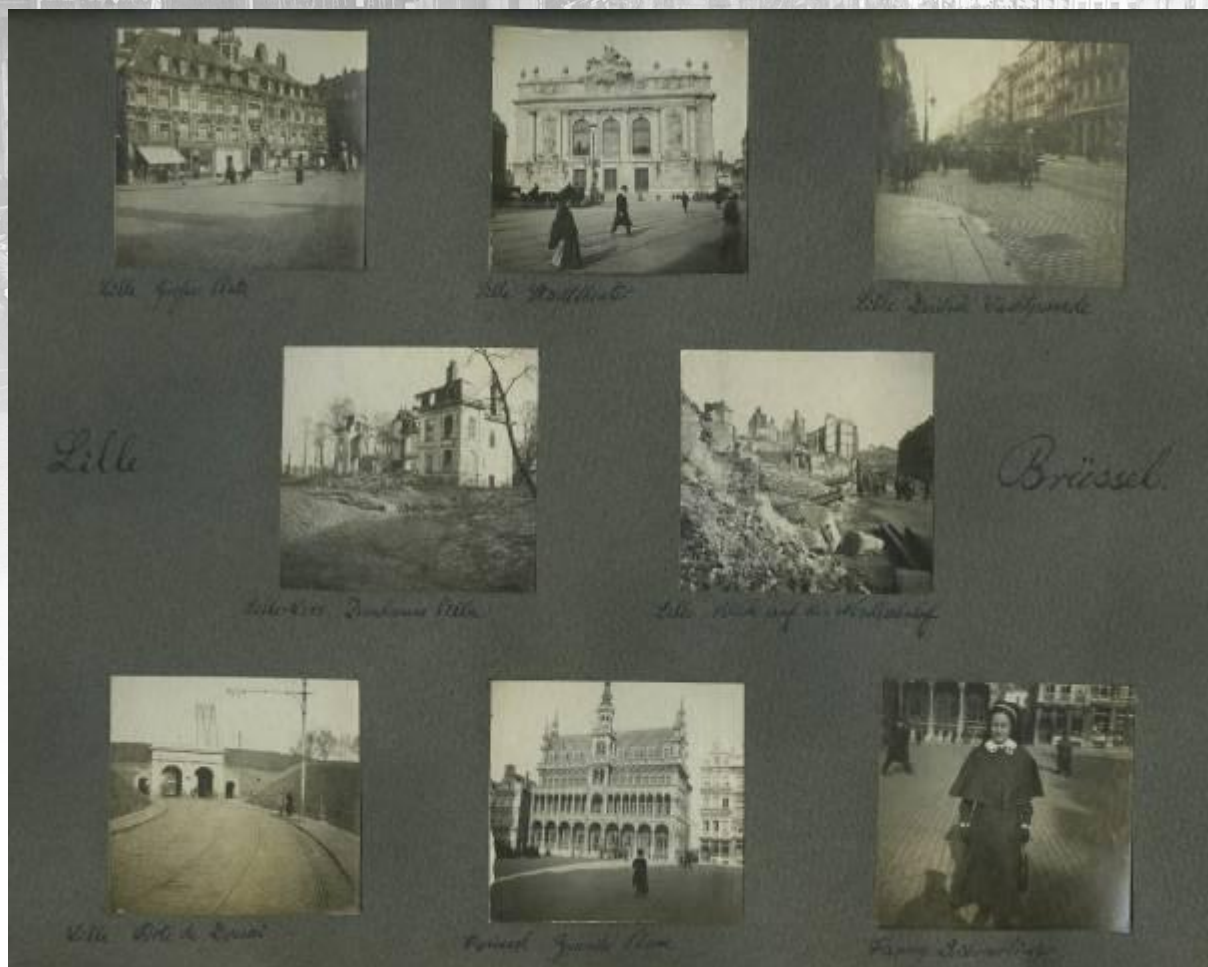
Référence : D113 PAGE 32 Troupes allemandes à Lille et Bruxelles.