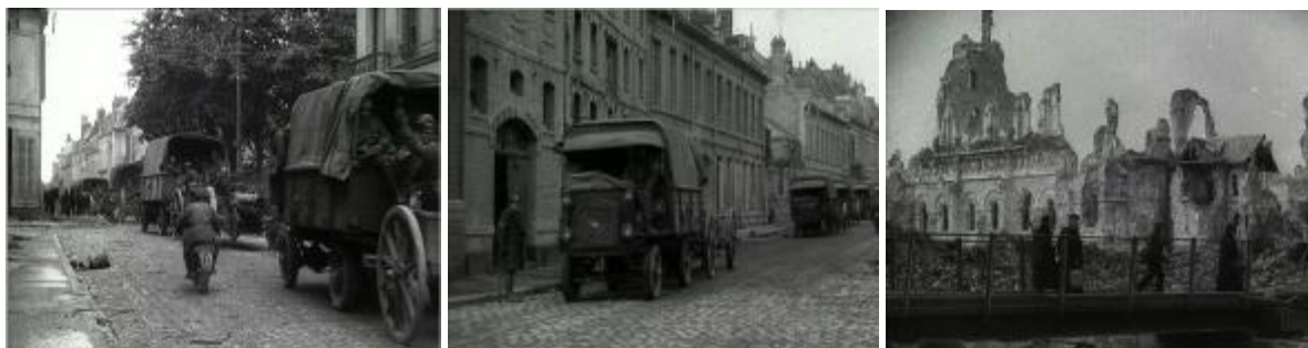
Photogrammes extraits du film : Ruines de Merville, soldats canadiens dans Cambrai. Noir et blanc, muet, durée : 03mn 29 sec. © ECPAD. Réf. 14.18 B 457.