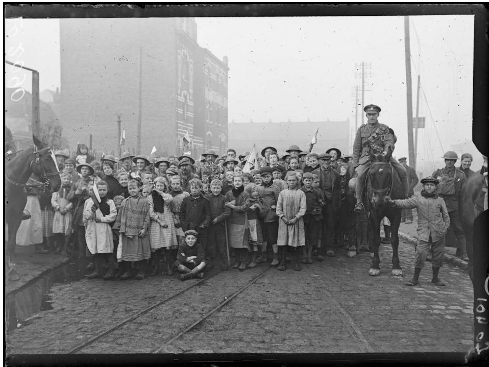
Référence : SPA 33 LO 2090 Lille, arrivée des troupes anglaises dans les faubourgs de la ville. 18 octobre 1918.