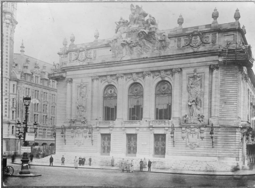
Référence : SPA 36 CT 2203 L'opéra de Lille pendant l'occupation allemande. Sans date.