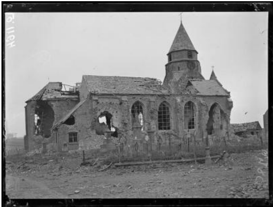
Référence : SPA 14 LO 1164 Westouter. L'église. Situé à une douzaine de kilomètres au sud-ouest d'Ypres, le village de Westouter a subi de nombreuses destructions. Octobre 1918.