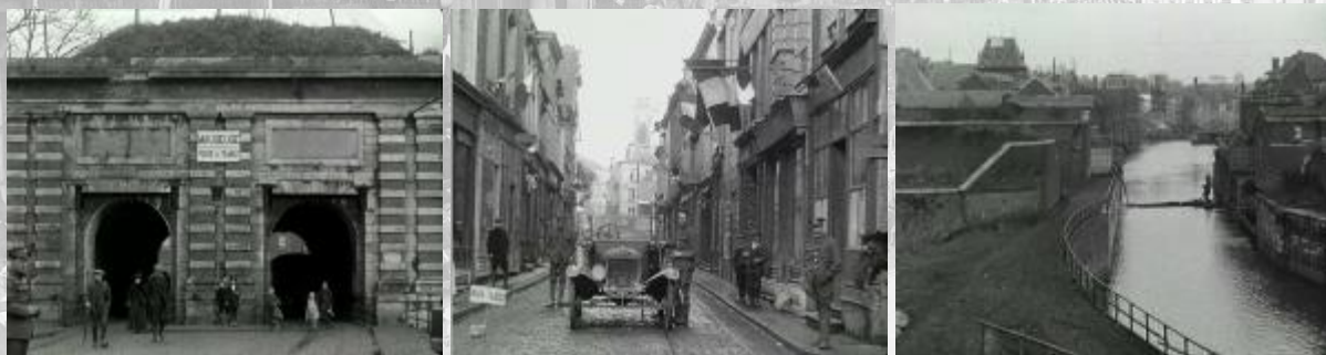
Photogrammes extraits du film : Prisonniers libérés, libération de Maubeuge. Noir et blanc, muet, durée : 16 mn 14 sec. Réf. 14.18 A 379.