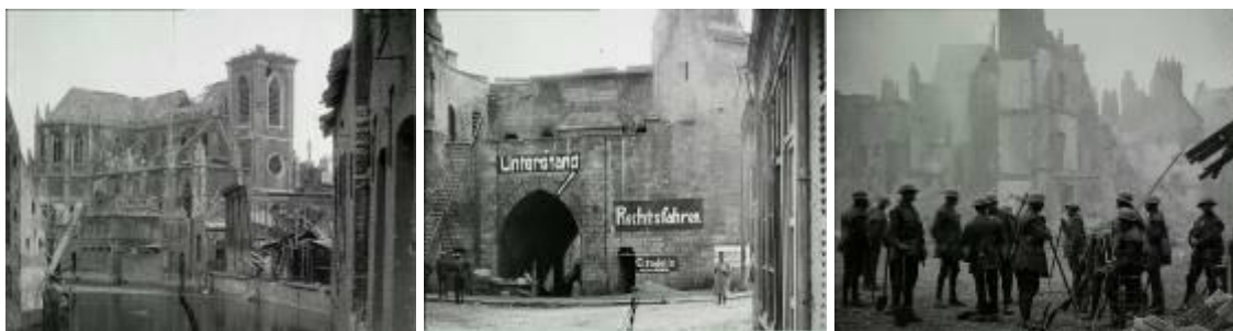
Photogrammes extraits du film :

Devant la poussée victorieuse des alliés, les Allemands se vengent en incendiant les villes qu'ils évacuent. Noir et blanc, muet, durée : 18mn 35 sec. Réf. 14.18 A 552.