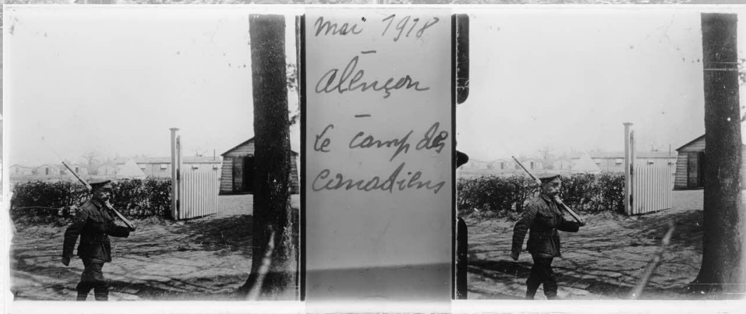
Alençon, le camp des Canadiens. Mai 1918.