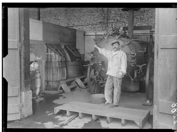
Référence : SPA 65 A 2288 Clermont-Ferrand. Hôpital n°78 : désinfection. Octobre 1917.