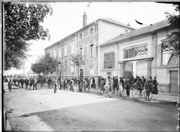
Référence : SPA 106 P 1343 Clermont-Ferrand (Puy-de-Dôme). Usine de caoutchouc Bergougnan : la sortie des ouvriers. Septembre 1917.