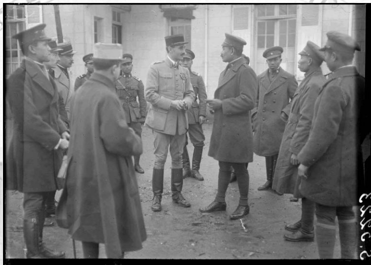
Référence : SPA 151 S 5223 Pau (Basses-Pyrénées, actuelles Pyrénées-Atlantiques). Le prince Charoon, représentant le roi du Siam Rama VI, est reçu par le commandant de l'école d'aviation. Septembre 1917.