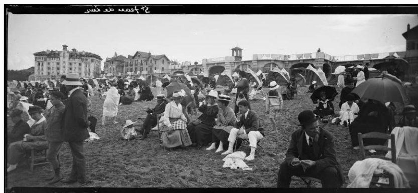
Référence : D170-6-14 Saint-Jean-de-Luz, sur la plage. 1914-1918.