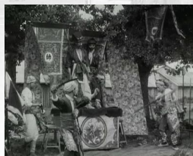
Photogrammes du film Dans les formations indigènes, le théâtre des Annamites Noir et blanc, muet, durée : 00:09:15. © ECPAD. Réf. 14.18 A 363