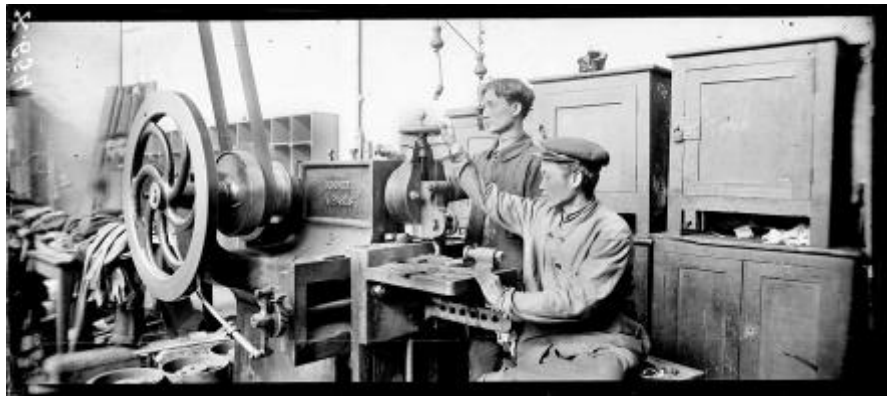
Référence : SPA 15 X 654 Ouvriers annamites de l'arsenal de Tarbes travaillant sur un étau limeur. 8 avril 1916.