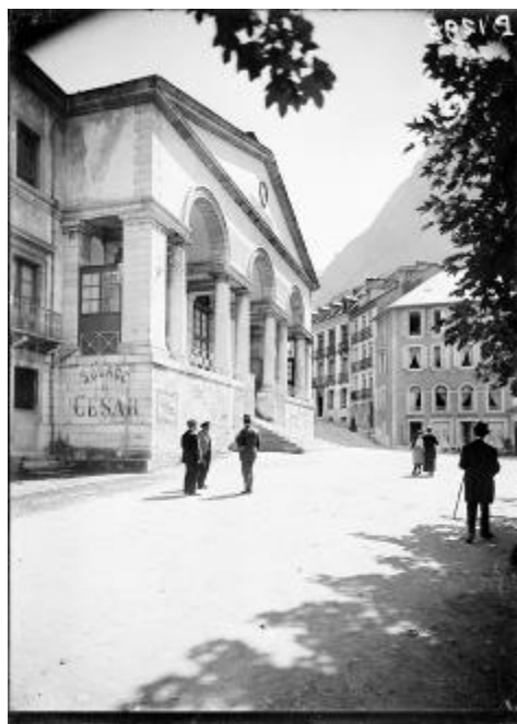
Référence : SPA 106 P 1298 Cauterets (Hautes-Pyrénées) : les installations thermales et le casino. Août - octobre 1917.