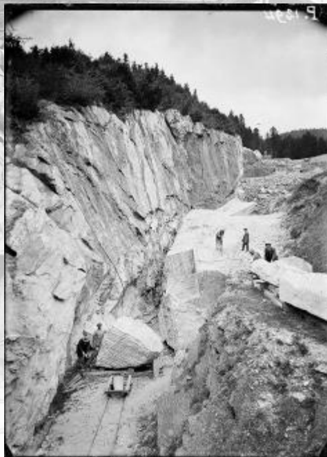
Référence : SPA 106 P 1294 Campan (Hautes-Pyrénées) : les carrières de marbre. Août - octobre 1917.