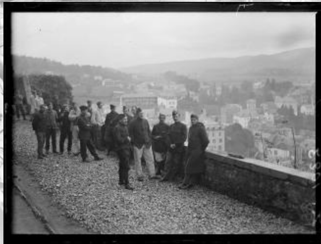
Référence : SPA 21 Z 1023 À Lourdes, les prisonniers allemands, officiers et sous-officiers, sont rassemblés au pied du château. 8 novembre 1915.