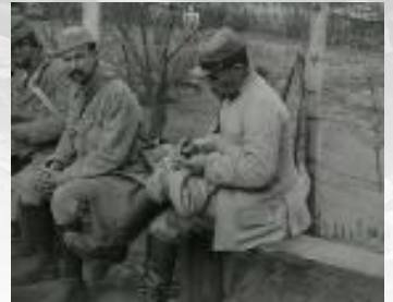
Photogrammes extraits du film Fête des chasseurs à Apremont. Gare de permissionnaires de Seveux. La gare régulatrice de Crépy-en-Valois. Noir et blanc, muet, durée : 15 min 32 sec. Réf. 14.18 A 369.