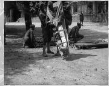
Photogrammes extraits du film Soldats noirs américains dans les camps d'entraînement de la Haute-Marne, juillet 1918. Noir et blanc, muet, durée : 17 min 47 sec. Réf. 14.18 A 1125.