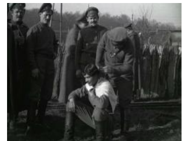
Photogrammes extraits du film Théâtre au front. Camp russe. Revue du général Pétain. Noir et blanc, muet, durée 13 min 03 sec. Réf. 14.18 B 470.