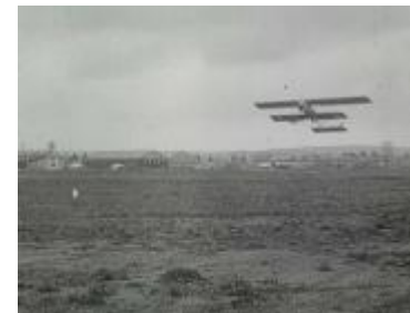
Photogrammes extraits du film Nieuport, escadrille La Fayette à Luxeuil-les-Bains, 14 mai 1916. Noir et blanc, muet, durée : 10 min 38 sec. Réf. 14.18 B 370.