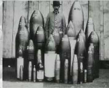
Photogrammes extraits du film L'usine du Breuil de la société Schneider : la fabrication des obus Août 1916. Noir et blanc, muet, durée 10mn 07sec. Réf. 14.18 A 1072.

Les pièces métalliques de récupération sont transportées jusqu'aux gigantesques fours, chargés par les ouvriers. Après huit heures de combustion, la coulée d'acier est répartie dans des moules afin de former des lingots qui, une fois ouvragés, donneront naissance aux obus de différents calibres. Les opérateurs suivent les ouvriers de l'usine lors des différentes étapes de la fabrication : l'ogivage, la trempe, le calibrage, le poinçonnage et enfin le stockage. Les dernières séquences montrent le chargement à bord de trains et de camions pour la répartition et la distribution aux unités d'artillerie.