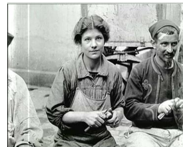
Photogrammes extraits du film Paris après trois ans de guerre 1917. Noir et blanc, muet, durée : 00:28:15. Réf. 14.18 B 369