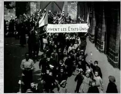
Photogrammes extraits du film Les Teddies en France Juillet 1917. Noir et blanc, muet, durée : 00:12:49. Réf. 14.18 A 1153

Cent quarante ans après l'aide prêtée par la France, l'Amérique se souvient et des soldats débarquent à Saint-Nazaire (Loire-Atlantique). À Paris, un régiment d'infanterie défile, musique en tête, sous les ovations de la foule, et gagne la caserne de Reuilly. La fête de l'Indépendance donne lieu à une série de manifestations dans la capitale.