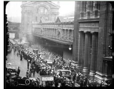
Photogrammes extraits du film Arrivée du général Pershing à Paris 13 juin 1917. Noir et blanc, muet, durée : 00:12:59. Réf. 14.18 A 1139

Une foule nombreuse est venue accueillir le général Pershing, gare du Nord. Il prend place dans une voiture en compagnie de M. Painlevé, président du Conseil, et gagne la place de la Concorde.