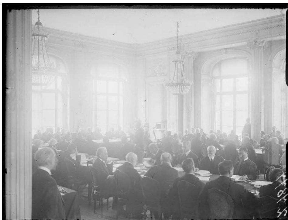
Référence : SPA 230 Z 7877 Remise aux Allemands du traité de paix au Trianon Palace, à Versailles. Mai 1919