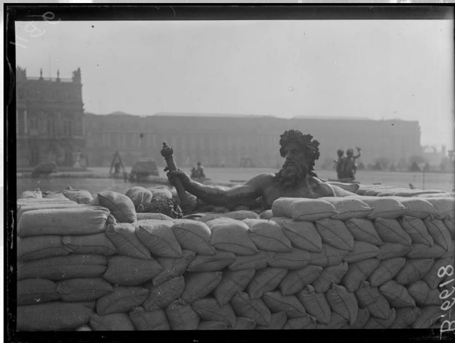
Référence : SPA 132 B 6618 Travaux de protection des fontaines du château de Versailles après le bombardement du 31 janvier 1918. Février 1918.