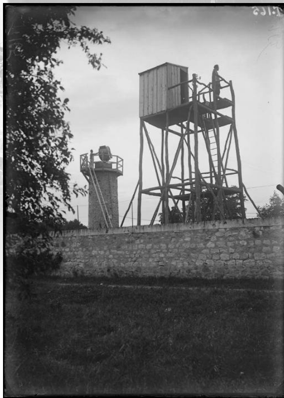
Référence : SPA 10 T 165 Conflans-Sainte-Honorine. Installations de la DCA. Le projecteur isolé et son observatoire. Août 1915. Photographe : Tétart/© ECPAD