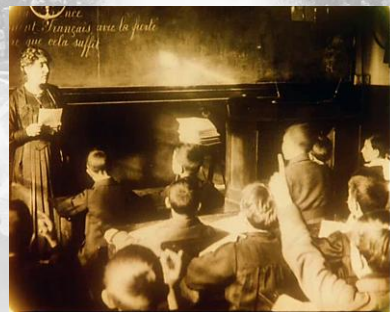
Photogrammes extraits du film

La femme française pendant la guerre 1918.