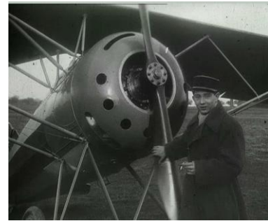
Photogrammes extraits du film

Aviation : visite d'une mission américaine à Villacoublay Portraits de pilotes sur Morane Parasol 1917-1918.