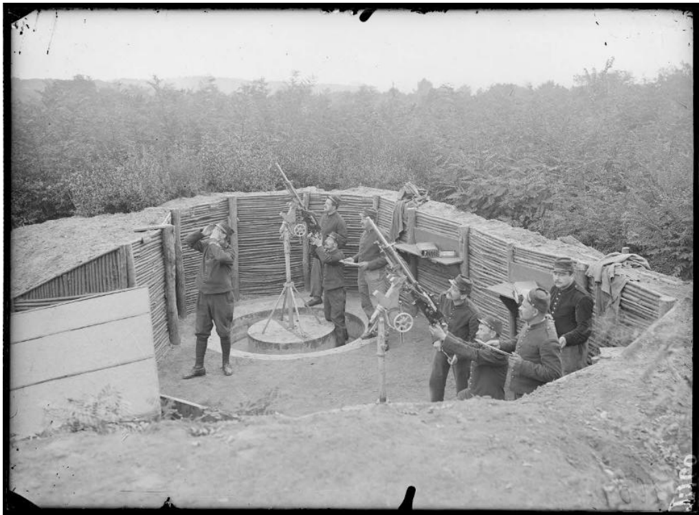
Référence : SPA 10 T 160 Corneilles-en-Parisis, le fort et ses défenses anti-aériennes. Les mitrailleuses. Août 1915.