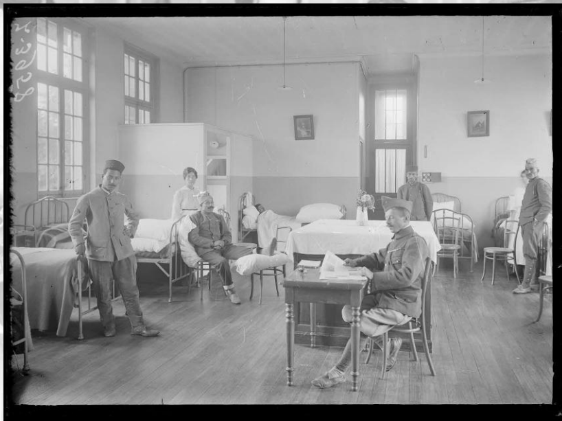
Référence : SPA 100 Z 3958 L'hôpital de Moisselles. Juillet 1917.