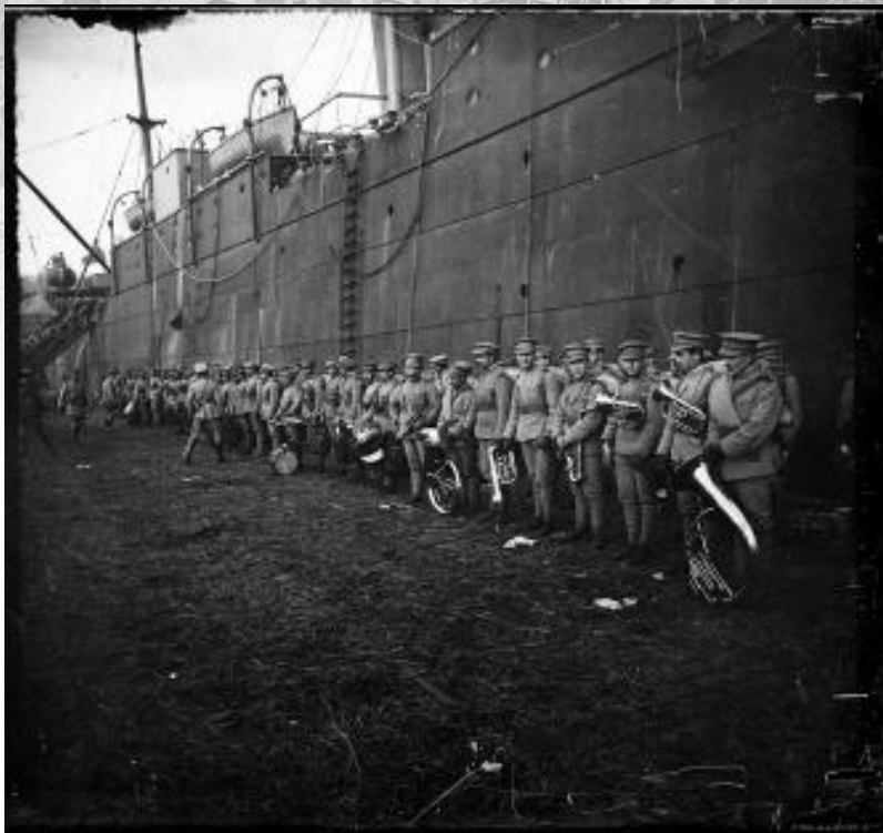
SPA 48 L 2227D.

Le débarquement de la musique portugaise du City of Benares à Brest. Date : 6 février 1917.