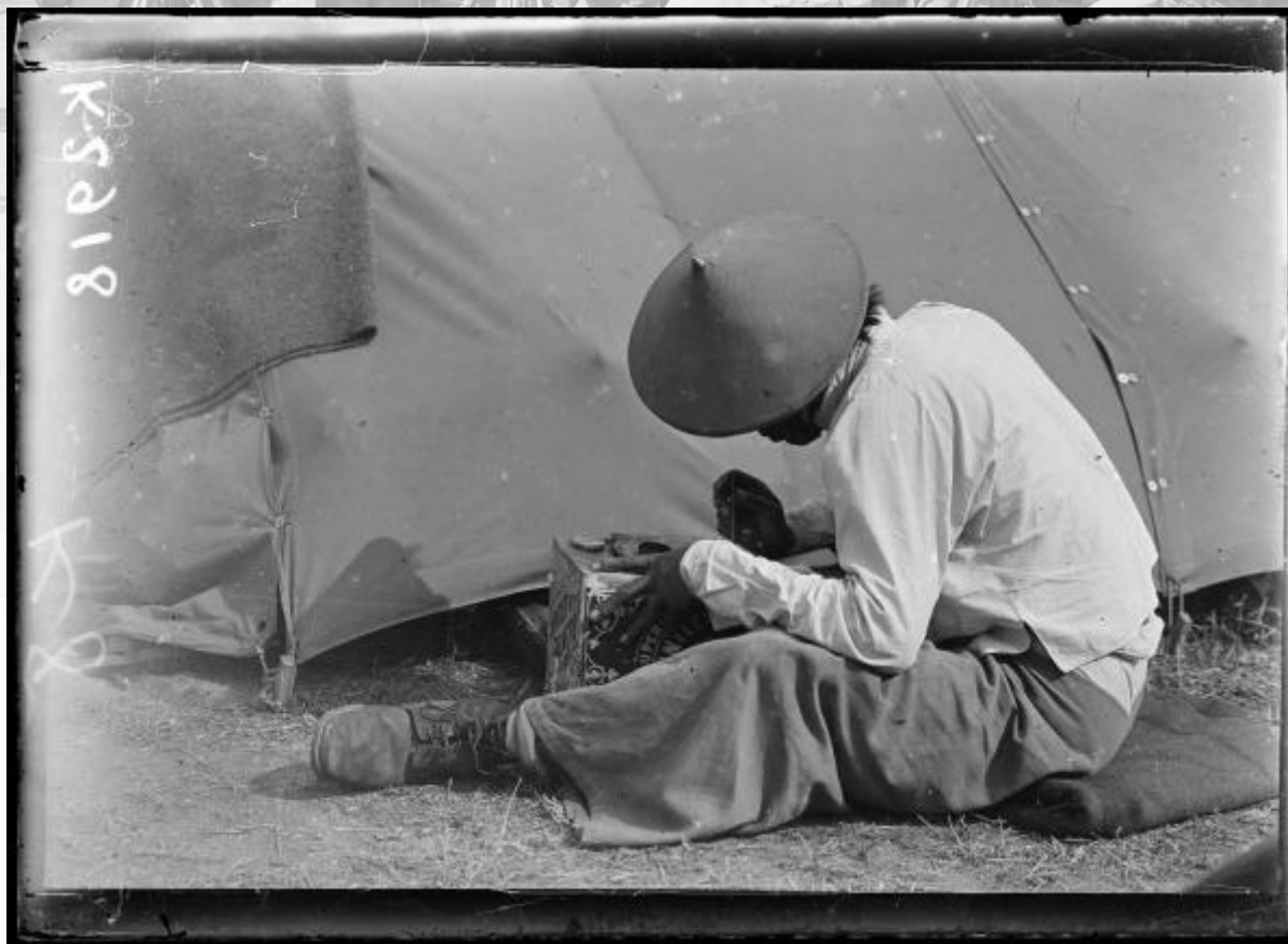
Référence : SPA 54 K 2918. Camp de Zeitenlick (Macédoine) : tirailleur annamite écrivant sa correspondance. Date : mai 1916.